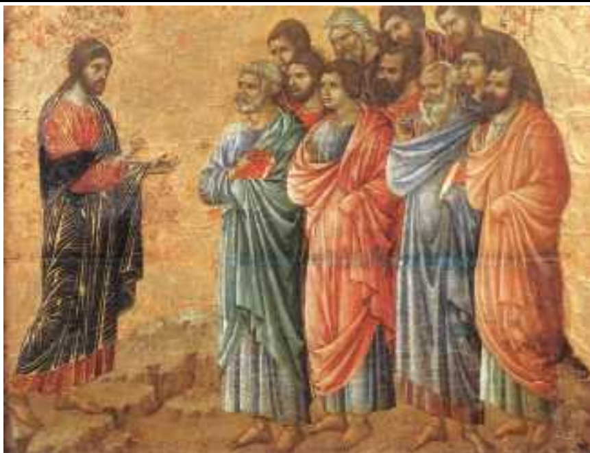
Cristo Risorto appare agli apostoli di Duccio (1255 - 1319), Siena, museo del Duomo

Il messaggio che viene dal carcere è ricco di riflessioni e spunti, anche ben argomentati; si rivolge a tutta la società, incoraggiandola a "investire" maggiori energie e iniziative per venire incontro a quanti vivono la prigione come un'occasione, purtroppo rara, di riabilitazione per sé e per gli altri. È un messaggio che riempie il cuore di speranza: anche la situazione più maledetta può essere messa sotto il segno della benedizione. In ogni evento, anche il più disperato, si può intravedere una via di uscita, che apre un nuovo orizzonte e un modo nuovo di