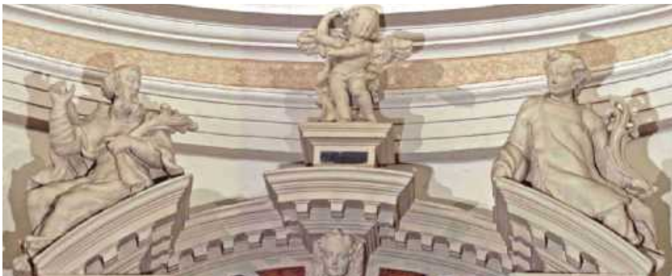
S. Anastasio (a sinistra) e S. Vincenzo (a destra) sopra il vecchio altare maggiore della nostra chiesa. Le statue, come l'altare, sono della fine del 1600.

Notiziario quindicinale dal 13 al 27 gennaio 2008