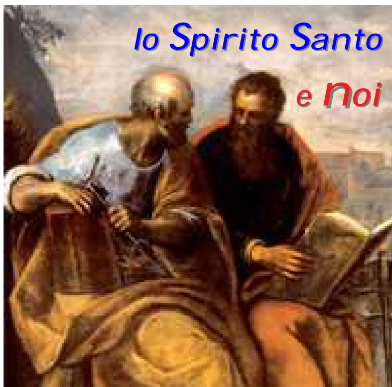
SS. Pietro e Paolo di Palma Giovane (1606) Monselice, Santuario delle sette chiesette

de nel segreto, ti ricompenserà. Matteo 6, 6. Si può fare anche in chiesa dove la presenza del Signore, Gesù Cristo nell'Eucaristia certo ci aiuta a sentire che quando preghiamo non stiamo parlando a uno che è lontano. Ma la Messa è "la Cena del Signore", quindi non un tempo per colloqui individuali. Lo scopo della Cena non è solo far crescere "la Comunione" (grande amicizia) tra noi e Lui, ma anche tra noi e gli altri (prima di tutto i presenti). Proprio durante la Cena il Signore ha detto "Vi do un comandamen-