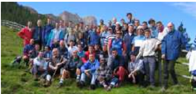
I ragazzi del Seminario Maggiore l'estate scorsa a Borca di Cadore.

Domenica 3 giugno alle ore 17, mentre qui a Peraga inizia la sfilata storica, presso la chiesa del Seminario Maggiore di Padova, il vescovo Antonio ordina 4 nuovi sacerdoti, che concludono quest'anno il cammino di formazione.