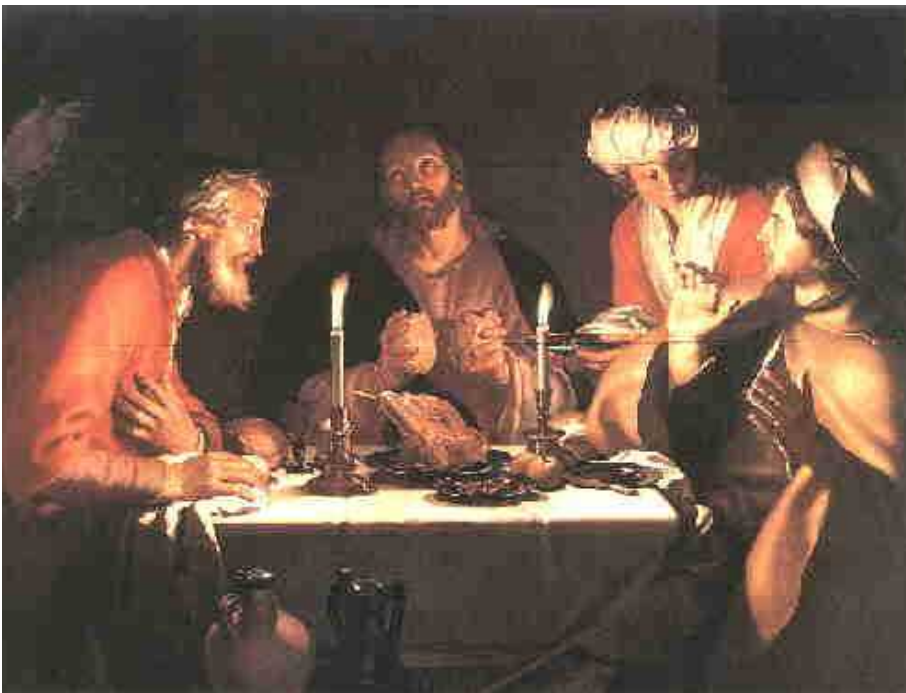
Il giorno di Pasqua con i discepoli di Emmaus di Bloemaert, 1586 - 1651, olio su tavola, Bruxelles, Museo Reale

Feriale 18 Sabato (festiva) 19 Domenicali e festive 8.30, 10.30, 17