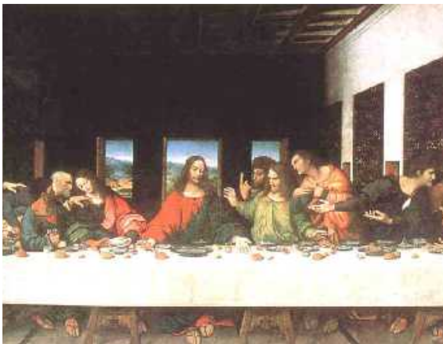
L'ultima Cena (particolare) di Leonardo Da Vinci (1452 - 1519) Originale conservato a Milano

L'espressione Prima Comunione forse presenta una difficoltà fondamentale nel fatto che concentra tutta l'attenzione sul momento in cui si mangia il pane eucaristico. Ma è "comunione" con Gesù Cristo