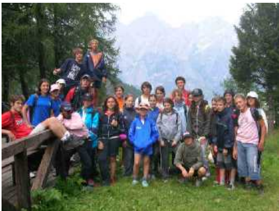
Foto di gruppo dei ragazzi del campo medie che sono andati a Caralte dal 23 al 30 luglio

Riflettendo sul testo della canzone di Syria "NON È PECCATO" abbiamo capito che per migliorare il nostro mondo, anche noi dobbiamo contribuire nel nostro piccolo con dei semplici gesti, ma alla base di tutto deve esserci l'amore, poiché esso è il motore di ogni cosa. Spesso, però, non abbiamo la forza di amare: qui entrano in gioco le regole. Se non abbiamo la forza di amare dobbiamo almeno avere la forza di rispettare gli altri: è proprio a questo che