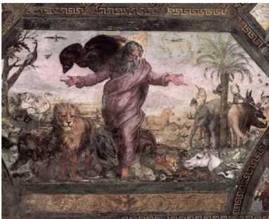
Creazione degli animali

Nella Bibbia i riferimenti alla bellezza e alla perfezione della creazione non si contano proprio. Cercarli è come perdersi in un oceano senza confini. Ci abbiamo provato e ci siamo ancorate ad un Salmo (104) che a riguardo ci sembra che esprima proprio tutto sulla bellezza della creazione (sicuramente ve ne