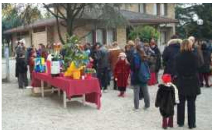
La castagnata del 2001, che si è tenuta all'aperto per i lavori del centro parrocchiale.