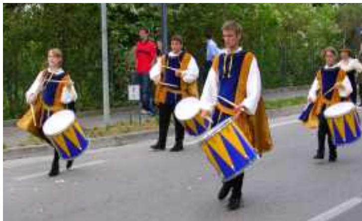
I tamburini di Peraga durante la 6ª edizione della Festa di Bonaventura

Numerose sono le attività svolte in questi dieci anni, le Feste della soppressa (con i proventi si è contribuito all'acquisto del terreno a sud del Centro Parrocchiale), le attività del tempo libero come le gite a Caralte, le escursioni sui colli, l'incontro di calcio genitori figli, la castagnata (con la quale si coglie l'occasione di portare le castagne anche a tutti i malati), la celebrazione della madonna di Lourdes con tutti i malati e anziani, con il momento conviviale insieme in patronato, e la consegna delle primule, le feste di Bonaventura (iniziate nel 1999 che si sono sviluppate nella festa che oggi tanti ci invidiano), l'incontro dei bimbi con Babbo Natale per le contrade nella notte della vigilia, la collaborazione della befana in piazza nel 2002, le cene, per gli anziani, per i santi patroni, per la festa della donna, lo spazio bambini in