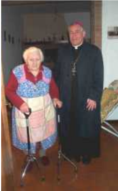
Una ammalata con il Vescovo Antonio. Il Mosaico contribuisce con il trasporto di ammalati alle visite in ospedale e al recapito di medicinali.

collaborazione con il comune, ed infine il progetto solidarietà attraverso la realizzazione del mercatino equo&solidale. Non mancano le azioni di visita agli anziani, quattro volte l'anno a Natale e Pasqua, in cui si porta l'omaggio realizzato dai bambini dell'a.c.r., durante la castagnata, durante la festa del malato, e ogni qualvolta ne facciamo richiesta o il volontario ne ha la possibilità, si aggiunge inoltre il nuovo servizio di consegna dei medicinali a casa.