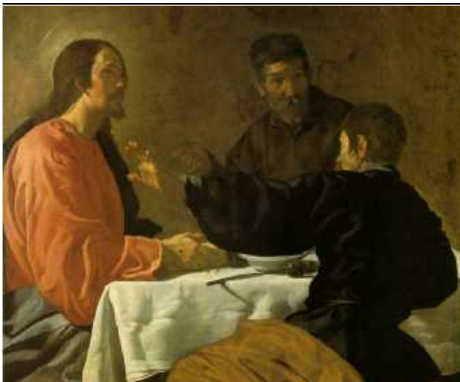
La Cena di Emmaus

Se uno tentasse di rispondere qualche cosa dalla scrivania di una stanza ben riscaldata nel palazzo di un giornale, o dalla cattedra di un'università... (continua in 2° pag.)