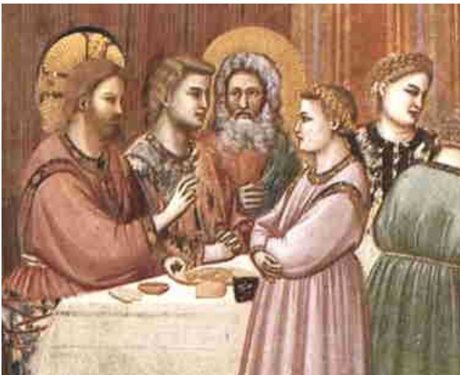
Cristo alle nozze di Cana (particolare) di Giotto di Bondone (1267 - 1337) Affresco a Padova, Cappella degli Scrovegni