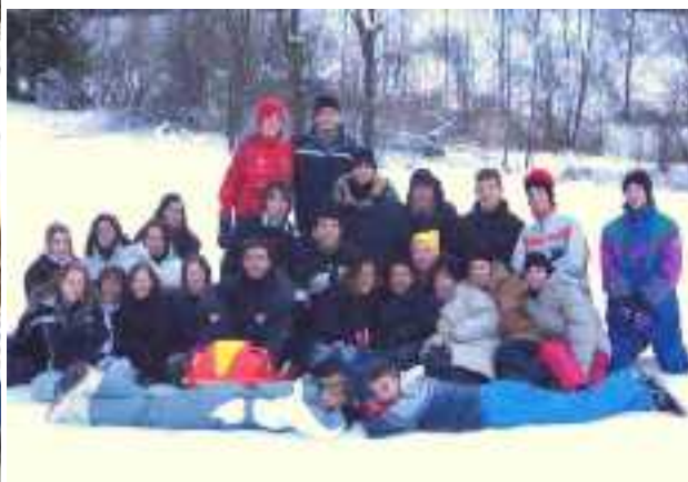
I ragazzi mentre si prendono un momento di relax fra una riflessione e l'altra...