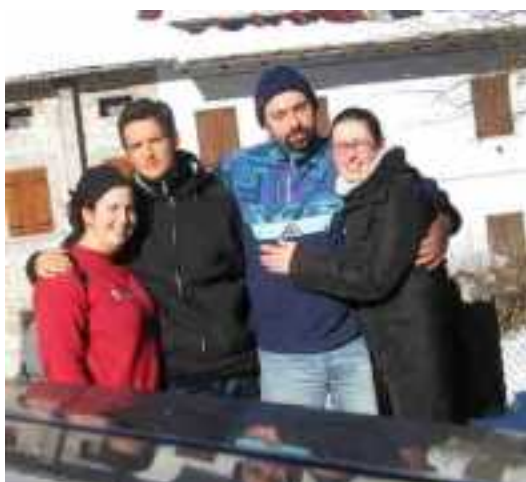
I due animatori storici del gruppo (a sinistra) e i due animatori per caso (a destra)

Fortuna ha voluto che quest'anno a Caralte ci fossero anche circa 30 cm di neve, che hanno permesso di divertirsi con tanta più neve di quella che è caduta pochi giorni fa qui a Peraga. Qui sotto ci sono due foto che fermano due dei momenti più belli (tantissimi) del campo.