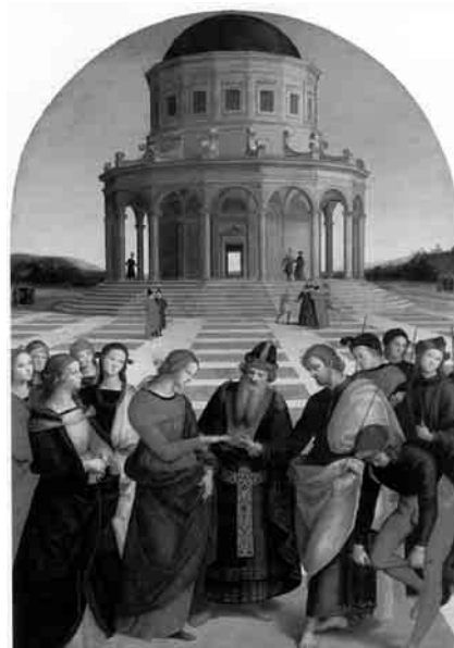
Raffaello - Sposalizio