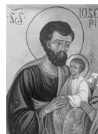
19 marzo S Giuseppe

Messa Crismale: in Duomo, mercoledì 12 aprile ore 18.