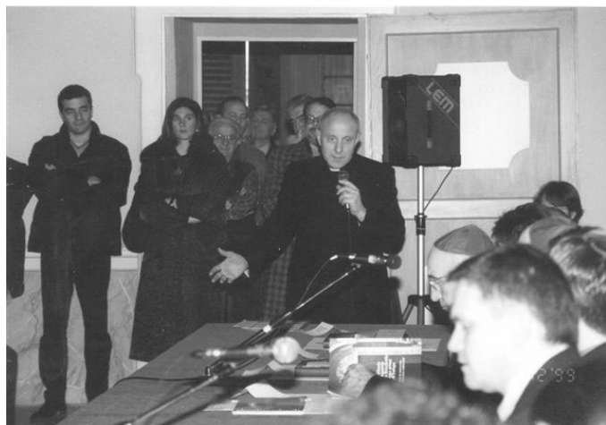
31-12-1999 – Inaugurazione del Museo Diocesano

Tutti i cristiani, pur sotto la guida del magistero, hanno il dono, il compito di accogliere la parola di Dio, ma non solo, devono penetrare in essa più a fondo, con retto giudizio ed applicarla pienamente alla vita.