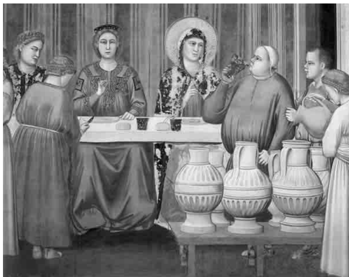
Nozze di Cana – Giotto – Cappella degli Scrovegni