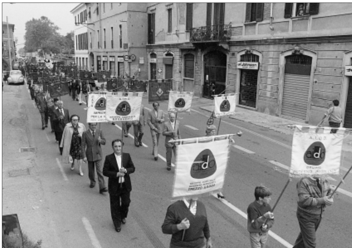
Corteo manifestazione AVIS in occasione del quindicesimo anniversario di fondazione