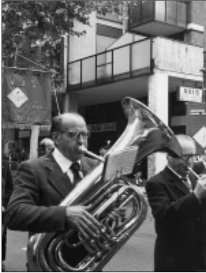
Banda musicale San Damiano in occasione dell'inaugurazione AVIS. Anno 1976.