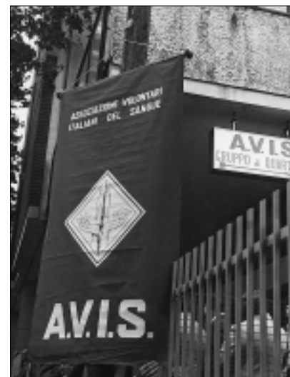
Inaugurazione della sede AVIS di viale Sant'Anna. Anno 1976