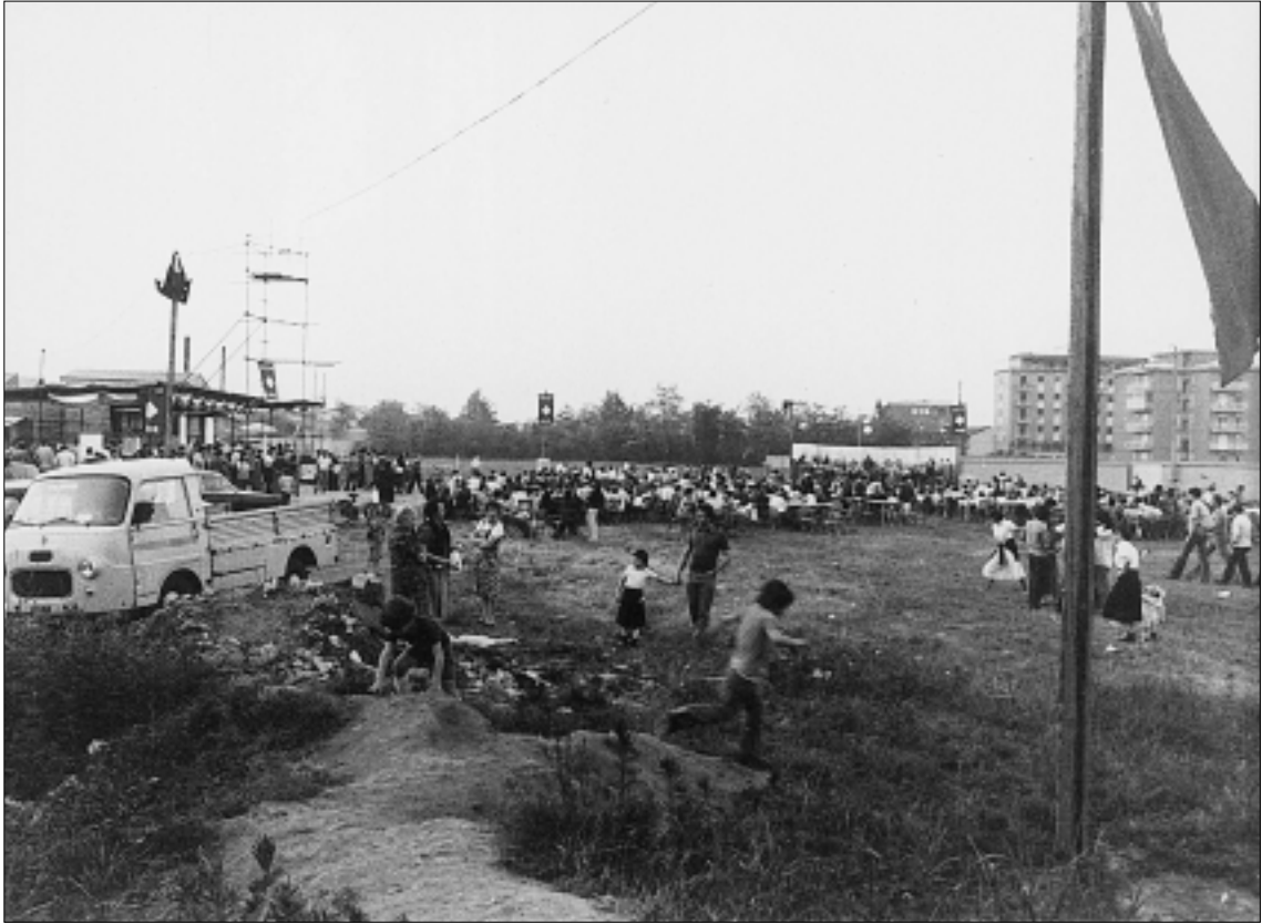
Prima sagra del pesce organizzata dall'AVIS nel 1976.