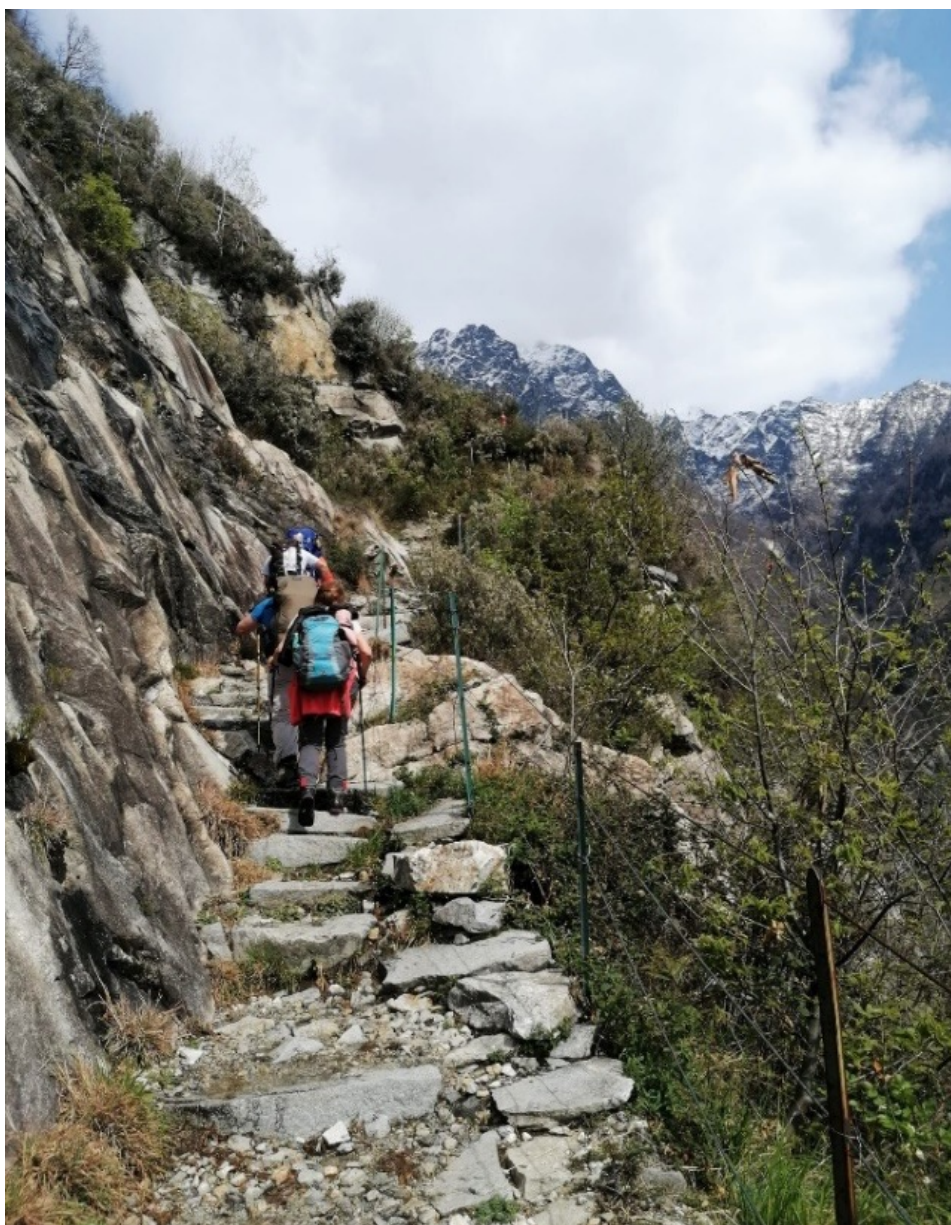
In salita verso Codera

Anche coloro che non vi hanno partecipato fisicamente, ci sono stati vicini con la loro presenza "spirituale", e passo passo, guardando le immagini che mandavamo attraverso la chat, hanno sostenuto le nostre fatiche ed emozioni di A.S.