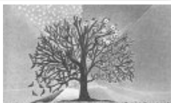
CASA FAMIGLIA GERICO