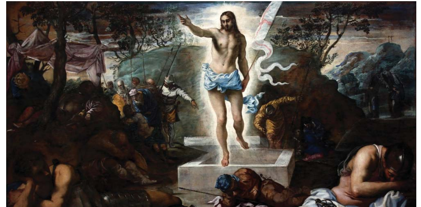
Tintoretto - la Resurrezione

SS. MESSE ORE 10:00 ASCENSIONE - ORE 11:15 SAN LORENZO