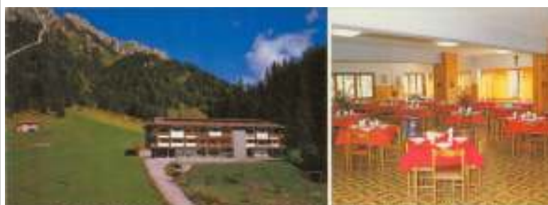
SOGGIORNO DOLOMITICO S.MARIA IN VIA