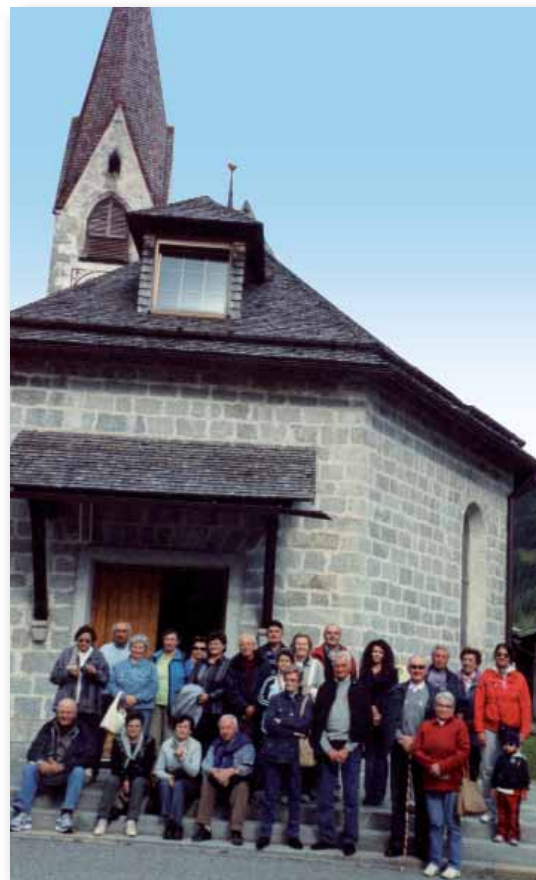
Vacanze 2011 in Valle Aurina