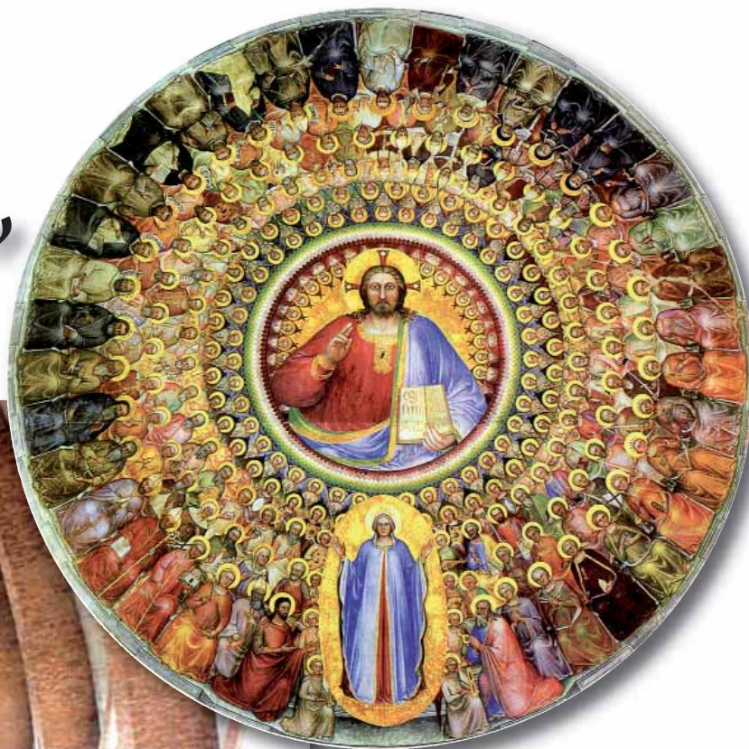
Logo degli “Esercizi Spirituali 2011”

“Paradiso” Affresco di Giusto de' Menabuoi. (1300) Padova: Battistero della Cattedrale.