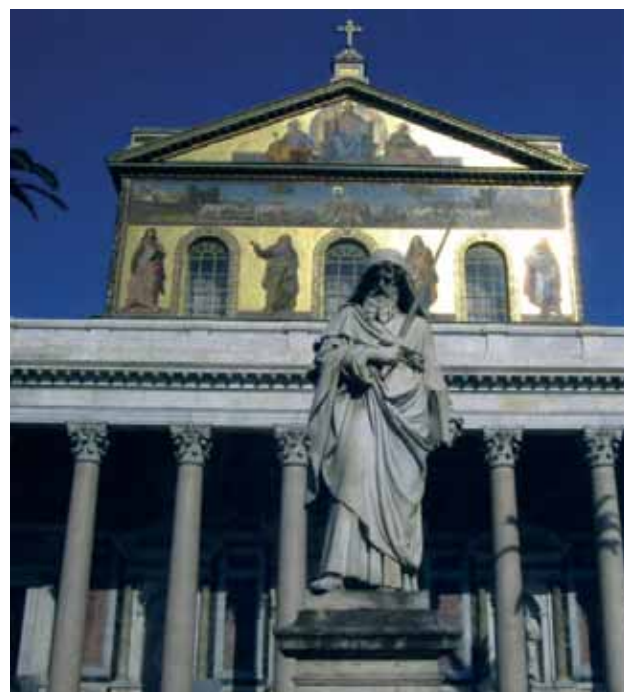
Roma: Basilica di S. Paolo fuori le Mura

Ulteriori informazioni nei fogli alle porte della Chiesa parrocchiale. Prenotazioni in segreteria parrocchiale.