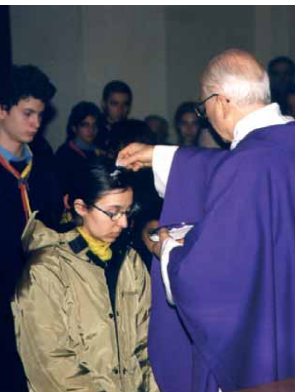
Mercoledì delle Ceneri

In un clima veramente familiare e con tanta partecipazione-oltre 800 presenze-abbiamo celebrato, domenica 8 febbraio, la Festa della Famiglia con una Messa solenne nella Palestra dell'Istituto Alberghiero. Un momento intenso e un po' emozionante quello del rinnovo delle promesse matrimoniali pronunciato da tanti sposi e particolarmente significativo per chi ricordava anniversari importanti: 10°, 25°, 50°, 60° di matrimonio . La famiglia è un dono prezioso, da conservare, custodire, difendere da tutte le insidie superficiali; rinnovarla e rinnovarne i sentimenti e i progetti è il modo per vivere bene la propria vita: il Signore benedica le nostre famiglie!