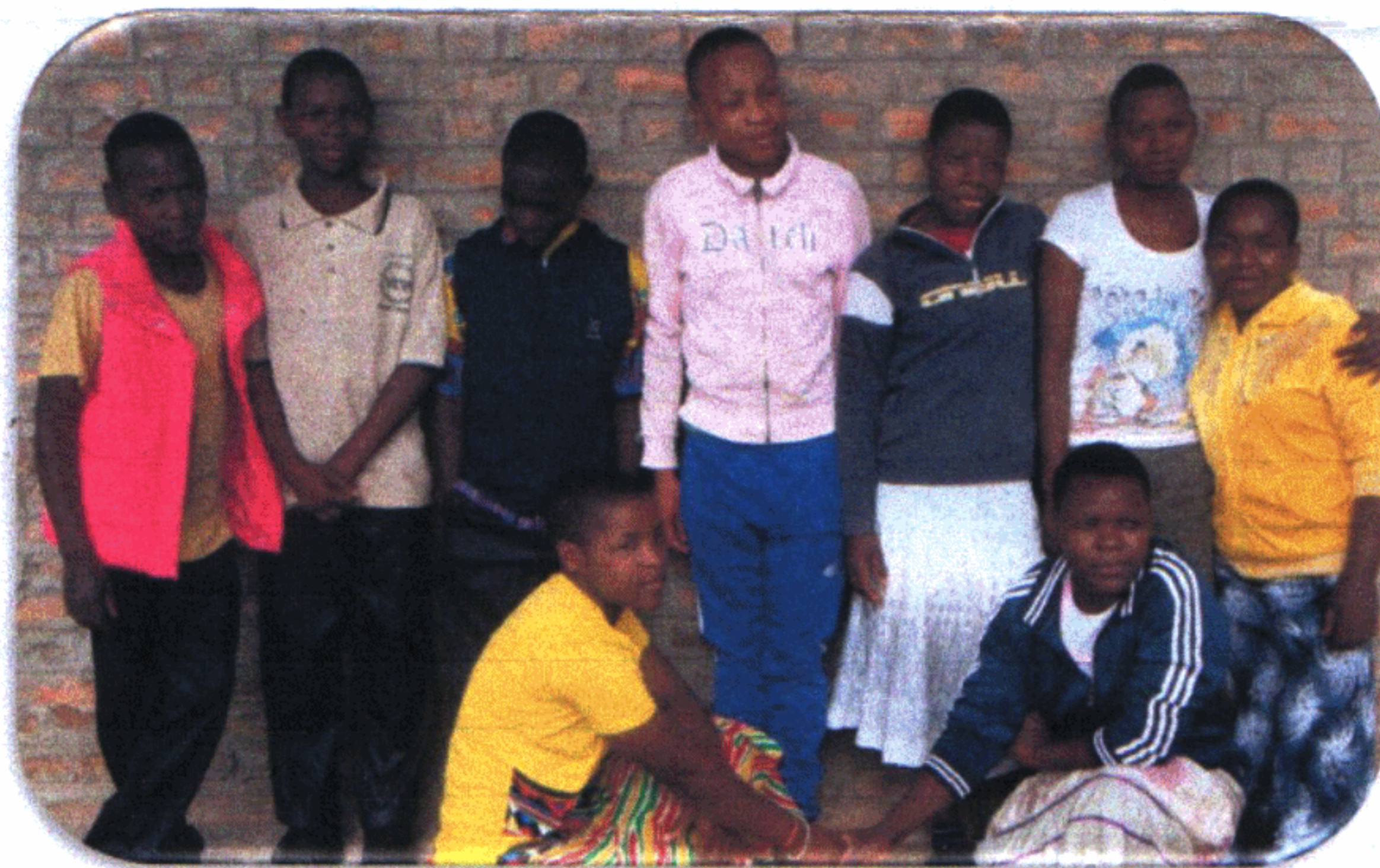
Il gruppo dei ragazzi più grandi