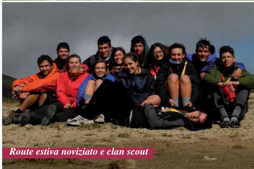
Route estiva noviziato e clan scout