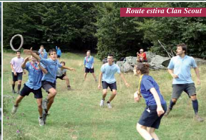
Route estiva Clan Scout