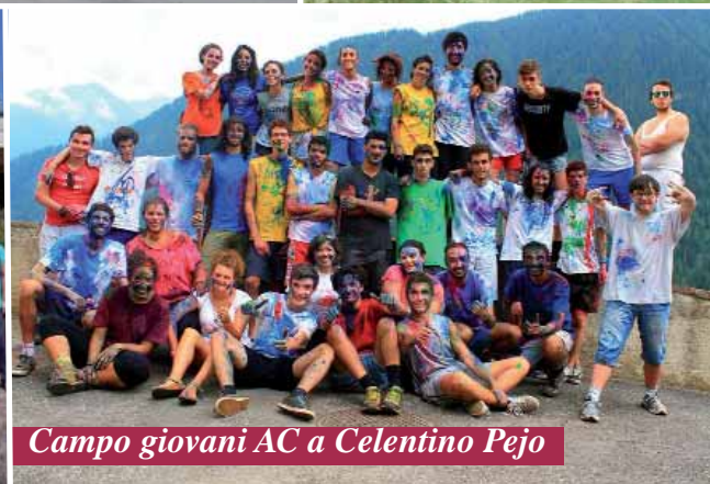
Campo giovani AC a Celentino Pejo