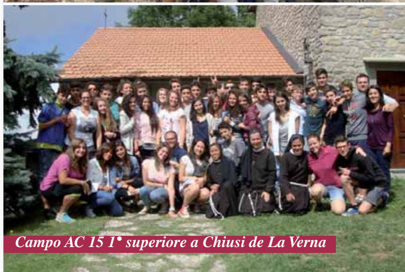
Campo AC 15 1° superiore a Chiusi de La Verna