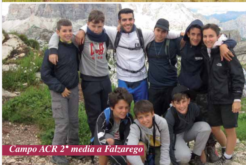
Campo ACR 2° media a Falzarego