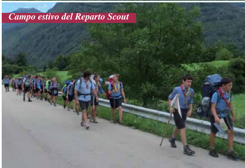
Campo estivo del Reparto Scout