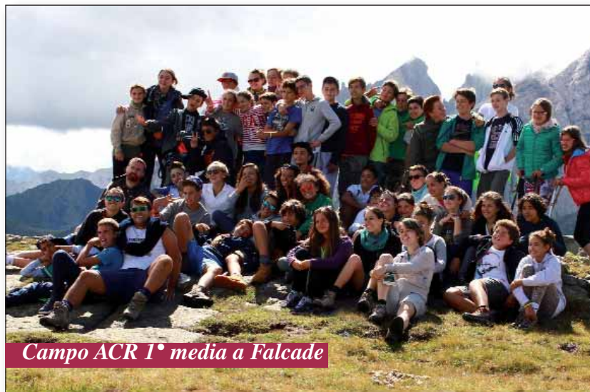
Campo ACR 1° media a Falcade

Via S. Martino, 49 - 40024 Castel San Pietro Terme- Bo - Tel. 051 941183 - Fax. 051 948060 - e-mail: santa.maria.maggiore@davide.it