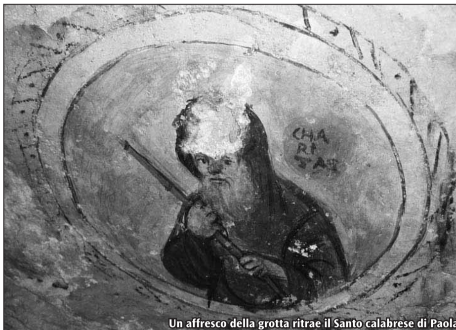
Un affresco della grotta ritrae il Santo calabrese di Paola

Nella storia del Terzo Ordine dei Minimi, Altilia riveste un'importanza fondamentale.