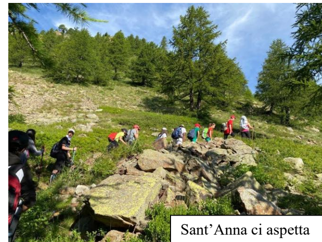
Sant'Anna ci aspetta